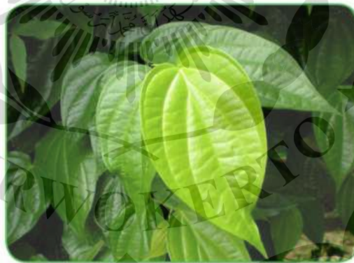
Gambar 4. Daun sirih ( Piper betle L.)

pada ekstrak daun sirih hijau ( Piper betle ) efektif terhadap kematian walang sangit dengan persentase kematian tertinggi yaitu pada konsentrasi 75%. Efektifitas daun sirih hutan yang telah dilaporkan oleh Darmayanti (2014) dalam Agustina, dkk (2017) juga mengemukakan bahwa pada konsentrasi 100 g/l air mampu menyebabkan mortalitas ulat S. Litura sebesar 85%, namun pada konsentrasi di bawah 10% yaitu 75 g/l air hanya mampu menyebabkan mortalitas ulat S. litura sebesar 70%. Tak hanya itu, hasil penelitian Akbar Fisabilillah (2020) menyatakan bahwa ekstrak tepung daun sirih hutan dengan konsentrasi 75 g.l-1 air merupakan konsentrasi yang efektif dalam mengendalikan hama S. frugiperda karena konsentrasi ini telah mampu menyebabkan mortalitas total sebesar 80% dengan waktu awal kematian 11,75 jam setelah aplikasi dan lethal time 50 pada 43,25 jam setelah aplikasi.