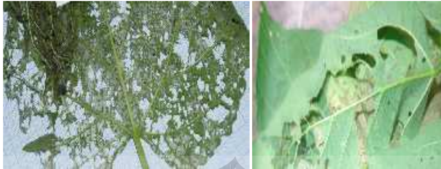
Gambar 2. Gejala daun kedelai yang terserang ulat grayak (Fattah dkk , 2016).