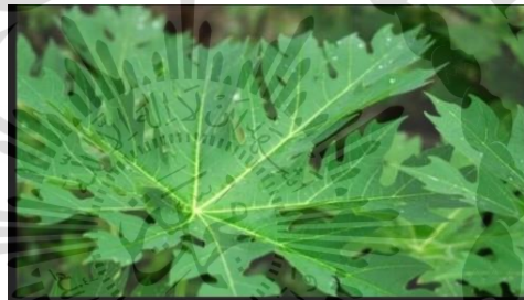
Gambar 3. Daun Pepaya

Sayuran pepaya dikenal sebagai tanaman pepaya, family Caricaceae yang berasal dari Amerika Tengah dan Hindia Barat bahkan kawasan sekitar Meksiko dan Costa Rica. Tanaman ini disebarluaskan ke berbagai penjuru dunia oleh para pedagang Spanyol. Tanaman buah menahun ini tumbuh pada tanah lembab yang subur dan tidak tergenang air, dapat ditemukan di dataran rendah sampai ketinggian 1000 m di bawah permukaan laut (Olabode, et al 2007).