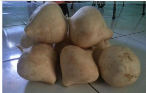
Gambar 2.1 Umbi bengkuang