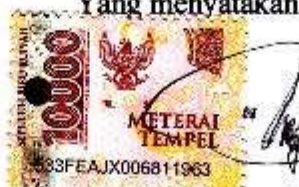
Gita Asih Pusparini