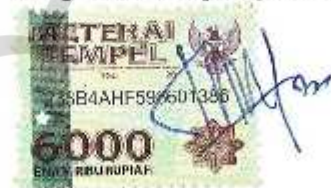
Erly Purwo Utami