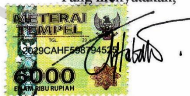
Aji Tabah Prayoga