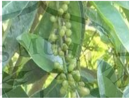
Gambar 2.1 Daun Buni (Orwa et al. , 2009)

Tanaman ini dikenal dengan nama Wuni di Jawa dan Sunda, Burneh di Madura, Bunie tedong di Sulawesi, dan di Melayu dikenal dengan nama Buni (Hariyana, 2013). Di luar negeri nama bignai di Filipina, ma maoluang di Thailand, choi moi di Vietnam, kywe-pyisin di Birma, antidesma di Prancis dan Chinese laurel di Inggris (Orwa et al. , 2009).