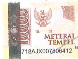
Sigit Budi Prasetyo