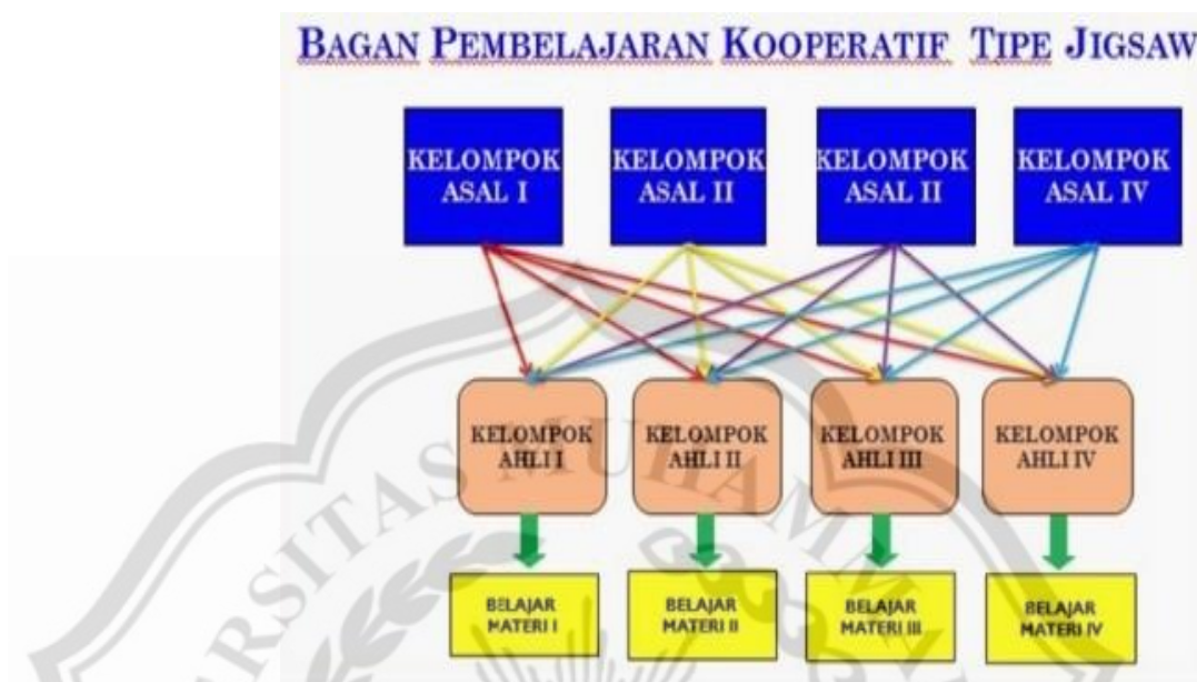
Gambar 2.1 model pembelajaran jigsaw