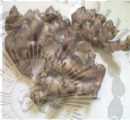
Gambar 2.1 Rimpang Jahe Emprit