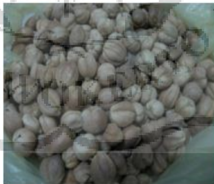
Gambar 2.2 Kapulaga