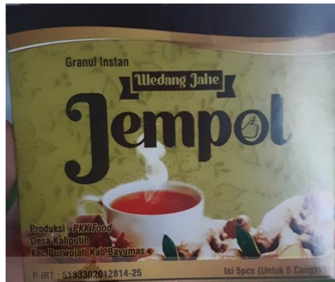
Gambar 2.3 Produk Jempol

Jahe emprit memiliki banyak khasiat antara lain sebagai campuran obat tradisional sebagai karminatif dan stimulan, penambah nafsu makan, tonik lambung, peluruh dahak, peluruh haid, pencegah mual, penurun tekanan darah, menghilangkan lelah, meningkatkan stamina, mencegah infeksi pada luka. Ekstrak jahe emprit mengandung senyawa gingerol, shogaol, dan zingerone yang memiliki aktivitas sebagai antioksidan, antiinflamasi, analgesik dan antikarsinogenik (Syarifah et al. , 2020).