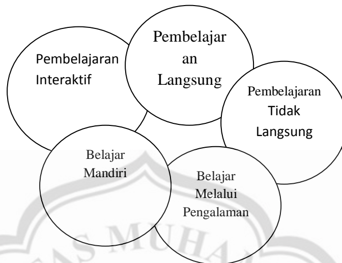
Gambar 2.3 Posisi Media dalam Sistem Pembelajaran