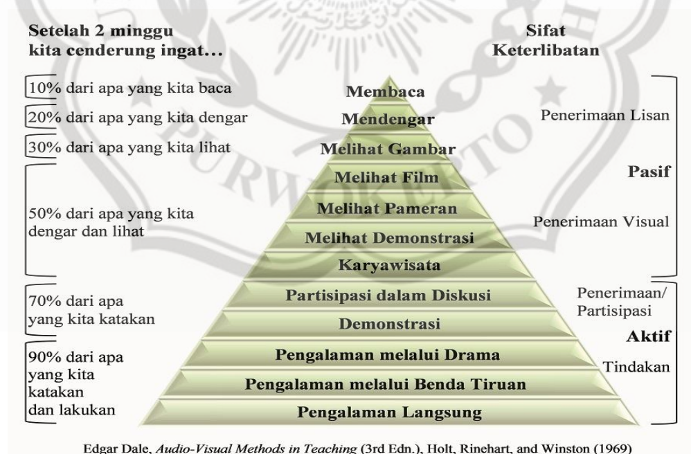
Gambar 2.1 Kerucut Pengalaman Edgar Dale

Sedangkan, Aqib (2013: 53) berpendapat bahwa ada beberapa hal yang perlu dipertimbangkan dalam memilih media pembelajaran, yaitu: (1) kompetensi pembelajaran, (2) karakteristik sasaran didik, (3) karakteristik media yang bersangkutan, (4) waktu yang tersedia, (5) biaya yang diperlukan, (6) ketersediaan fasilitas/ peralatan, (7) konteks penggunaan, (8) mutu teknis media. Selanjutnya Edgar Dale (dalam Daryanto, 2012:15) pernah mengembangkan “kerucut pengalaman” yang sampai sekarang masih relevan untuk dirujuk. Kerucut pengalaman menggambarkan jejang konkrit-abstrak dengan dimulai dari siswa yang berpartisipasi dalam pengalaman nyata, kemudian menuju siswa sebagai pengamat kejadian nyata, dilanjutkan ke siswa sebagai pengamat terhadap kejadian yang disajikan dengan media, dan terakhir siswa sebagai pengamat kejadian yang disajikan sebagai berikut.