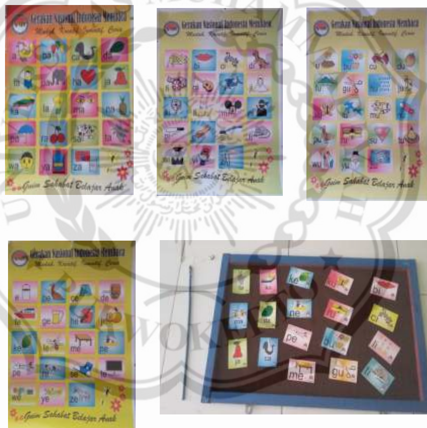
Gambar 2.1 Media Pembelajaran Permainan Memancing Kartu huruf Bergambar (Poster, Kartu Huruf Bergambar dan Alat Pancing).