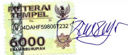
Barzaft Bafadal Zein