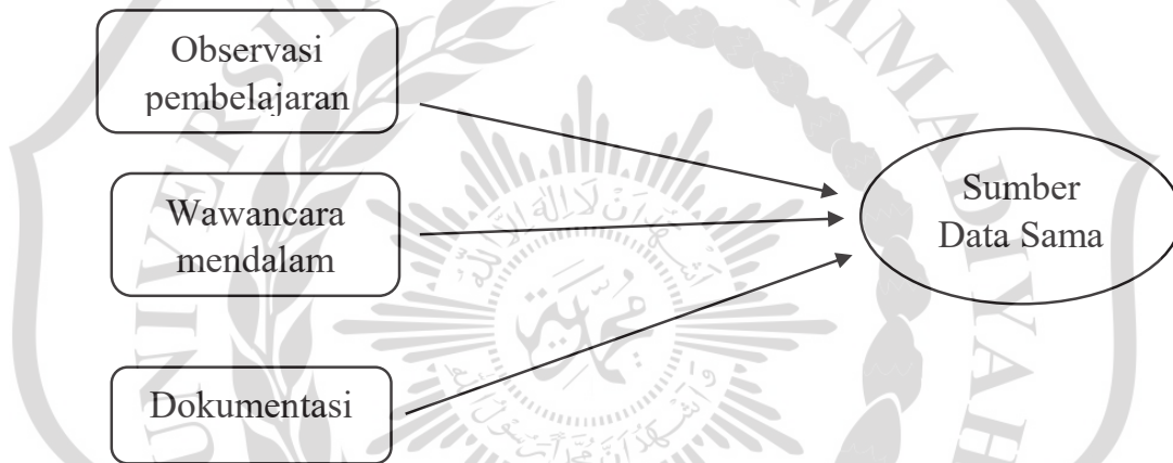
Gambar 1. Triangulasi “teknik” pengumpulan data (bermacam-macam cara pada sumber yang sama).

Triangulasi teknik, peneliti menggunakan teknik pengumpulan data yang berbeda-beda untuk mendapatkan data dari sumber yang sama. Peneliti menggunakan observasi partisipatif, wawancara mendalam, dan dokumentasi untuk sumber data yang sama serempak. Triangulasi sumber, berarti untuk mendapatkan data dari sumber yang berbeda-beda dengan teknik yang sama. Hal ini dapat digambarkan sebagai berikut :