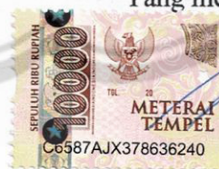
Taufik Tegar Priambodo