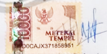
Siwi Wahyuning Palupi

Dibuat di : Purwokerto Pada Tanggal : 26 Agustus 2021 Yang menyatakan,