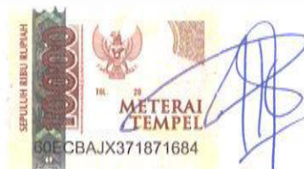
Rani Puspita Susilowati