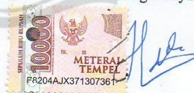
Habib Zulhaq Thoreqat