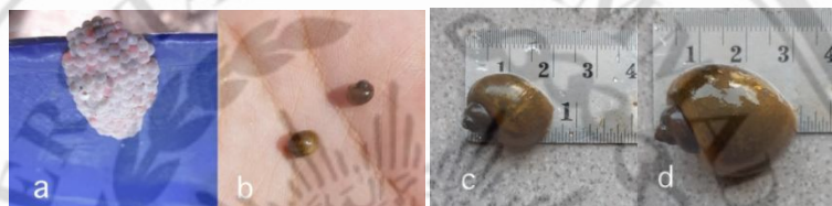
Gambar 2.2. Tahapan perkembangan keong mas. (a. Telur keong mas). (b. Nimfa keong mas). (c. Juvenil keong mas). (d. Imago keong mas).