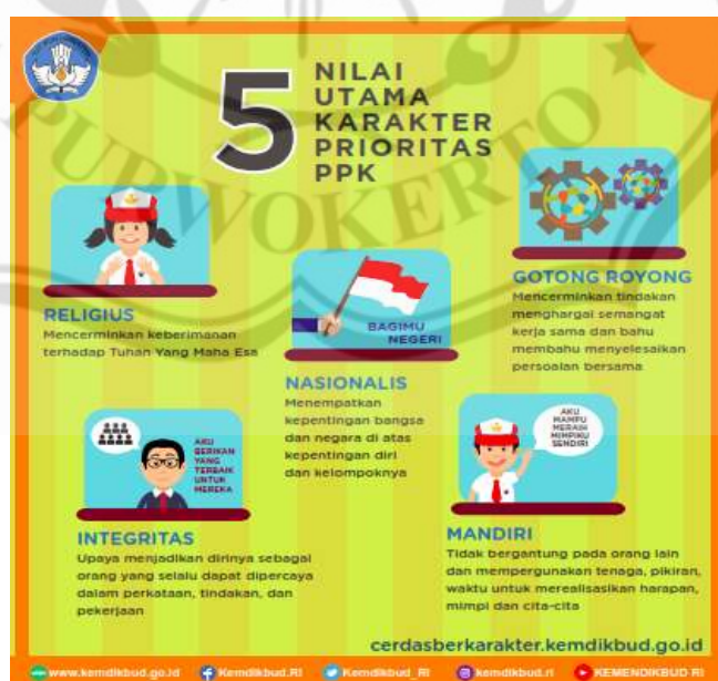
Gambar 2.2 Nilai Utama PPK

Nilai-nilai pendidikan karakter meliputi nilai religius, jujur, toleran, disiplin, bekerja keras, kreatif, mandiri, demokratis, rasa ingin tahu, semangat kebangsaan, cinta tanah air, menghargai prestasi, komunikatif, cinta damai, gemar membaca, peduli lingkungan, peduli sosial, dan tanggung jawab. Nilai-nilai yang dimaksud dalam Permendikbud No. 20 Tahun 2018 pasal 2 ayat 2 merupakan perwujudan dari 5 nilai utama yang saling berkaitan, yaitu religiositas, nasionalisme, kemandirian, gotong-royong, dan integritas, yang terintegrasi dalam kurikulum. Berikut adalah ilustrasi kristalisasi nilai karakter.