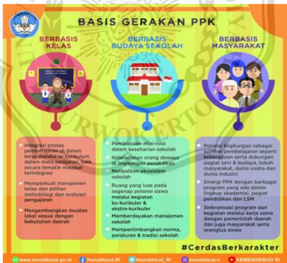
Gambar 2.3 Basis Gerakan PPK

Penerapan PPK dapat dilakukan dengan tiga pendekatan utama, yaitu berbasis kelas, berbasis budaya sekolah, dan berbasis masyarakat. Ketiga pendekatan ini saling terkait dan merupakan satu kesatuan yang utuh. Pendekatan ini dapat membantu sekolah dalam merancang penerapan program penguatan pendidikan karakter (PPK). Berikut adalah ilustrasi basis gerakan PPK.