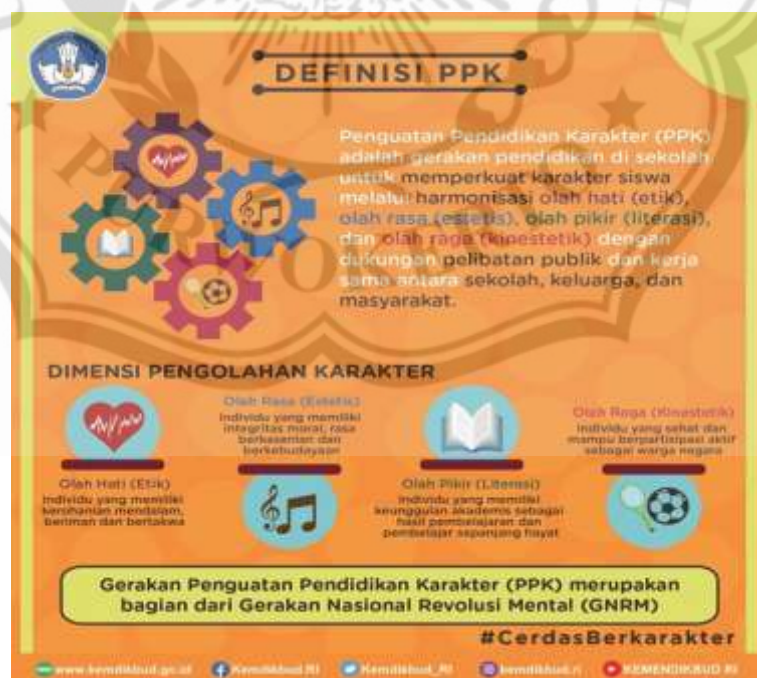
Gambar 2.1 Ilustrasi Penguatan Pendidikan Karakter

Penguatan Pendidikan Karakter yaitu gerakan pendidikan di bawah tanggung jawab satuan pendidikan untuk memperkuat karakter peserta didik melalui harmonisasi olah hati, olah rasa, olah pikir, dan olah raga dengan pelibatan dan kerja sama antar satuan pendidikan, keluarga, dan masyarakat (Perpres No.87 Tahun 2017). Pengembangan nilai-nilai karakter meliputi olah hati (etika) berkaitan dengan individu yang memiliki kerohanian mendalam, olah rasa (estetis) berkaitan dengan individu yang memiliki integritas moral dan memiliki rasa kesenian, olah pikir (literasi) berkaitan dengan individu yang memiliki keunggulan akademis sebagai hasil pembelajaran sepanjang hayat, dan olah raga (kinestetik) berkaitan dengan individu yang sehat dan mampu berpartisipasi sebagai warga negara. Berikut adalah ilustrasi Penguatan Pendidikan Karakter (PPK).