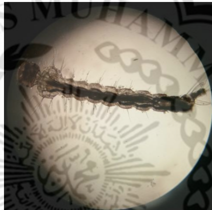
Gambar 2.3. Larva Nyamuk A. aegypti

Berdasarkan data dari Departemen Kesehatan Republik Indonesia tahun 2005 yang dikutip oleh Supartha (2008), tempat perkembangbiakan utama nyamuk A. aegypti adalah tempat-tempat penampungan air bersih di dalam atau di sekitar rumah, berupa genangan air yang tertampung di suatu tempat atau bejana seperti bak mandi, tempayan, tempat minum burung, dan barang-barang bekas yang dibuang sembarangan yang pada waktu hujan akan terisi air. Nyamuk ini tidak dapat berkembang biak di genangan air yang langsung berhubungan dengan tanah (Supartha, 2008).