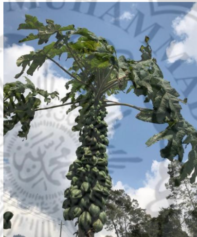
Gambar 2.1. Tanaman Karika ( C. pubescens )

menyerupai bentuk belimbing. Kulit buah karika yang belum matang berwarna hijau gelap dengan tekstur permukaan kulit yang licin dan akan berubah menjadi berwarna kuning ketika buah sudah matang. Kulit buah karika tebal dan memiliki getah yang banyak. Daging buahnya keras, berwarna kuning sampai jingga dengan rasa yang sedikit asam tetapi tetap berbau harum dan khas. Dalam daging buah terdapat rongga yang dipenuhi biji yang terbungkus oleh sarkotesta berwarna putih, bening, dan berair. Biji berwarna merah ketika karika masih mentah dan akan berubah menjadi hitam ketika carica matang. Biji karika berjumlah banyak dan padat.