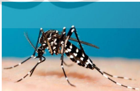
Gambar 2.2. Nyamuk A. aegypti

Kingdom : Animalia Filum : Arthropoda Kelas : Insecta Ordo : Diptera Famili : Culicidae Genus : Aedes Spesies : Aedes aegypti L. (Soegijanto, 2006)