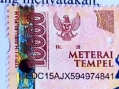
Bella Setia Monica