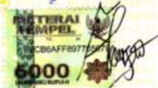
Nabila Destiyana Astika

Purwokerto, 20 Agustus 2019 Yang membuat pernyataan,