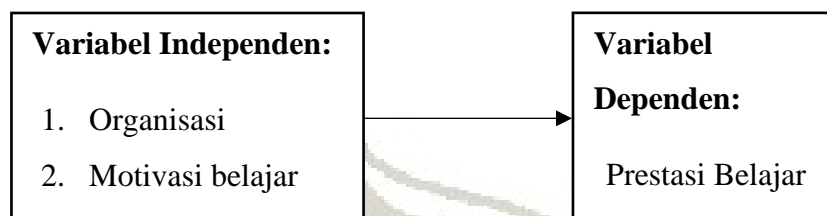
Gambar 2.3 Kerangka Konsep