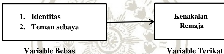
Gambar 2.2 Kerangka Konsep

Pada peneliti ini peneliti ingin meneliti mengenai gambaran perilaku kenakalan remaja di SMP puyud pracharak pattani Thailand.