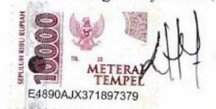
Hefty Elles Petrinda