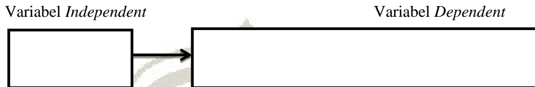
Gambar 2 Kerangka Konsep

Berdasarkan kerangka teori penelitian, maka peneliti menyusun kerangka konsep penelitian sebagai berikut :