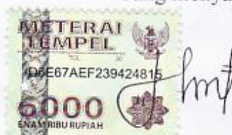
Mei Widi Astuti

Dibuat di : Purwokerto Pada tanggal: 4 Agustus 2019 Yang menyatakan,