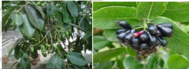
Gambar 2.2 Daun Jamblang ( Syzygium cumini L.) (Sari, 2017)