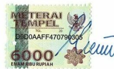
Della Meilisa Herwina

Purwokerto , Januari 2019 Yang membuat pernyataan