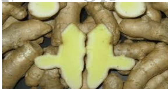
Gambar 2. Kunyit putih ( Curcuma Mangga Val)

Tanaman kunyit putih adalah tanaman semak yang berumur tahunan, rimpangnya berbentuk bulat, umbi yang di hasilkan adalah umbi batang, kulitnya terdapat banyak serabut serabut halus mirip rambut, rimpang ketika di belah berbentk seperti daging yang berwarna kuning muda dibagian tengah, cabang rimpangnya banyak, aroma khas daun mangga yang sudah matang, tetapi rasanya pahit dan getir.(pujimulyani,2016)