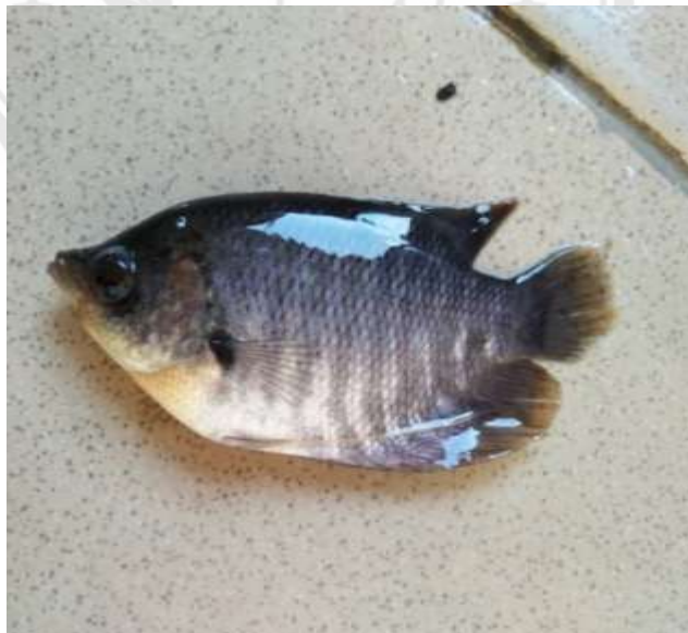
Gambar 2.1 Ikan Gurami ( Osphronemus gouramy )

Kingdom : Animalia Phylum : Chordata Class : Pisces Ordo : Labyrinthici Sub Ordo : Anabantoidae Family : Anabantidae Genus : Osphronemus Species : Osphronemus gouramy