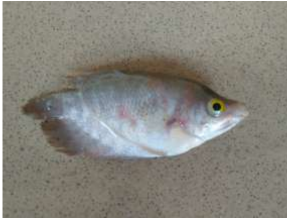
Gambar 2.3 Ikan Gurame yang terkena penyakit MAS