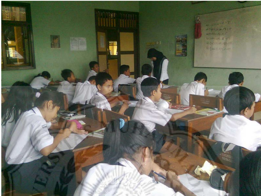
Gambar 5. Guru membantu siswa yang kesulitan dalam menulis puisi