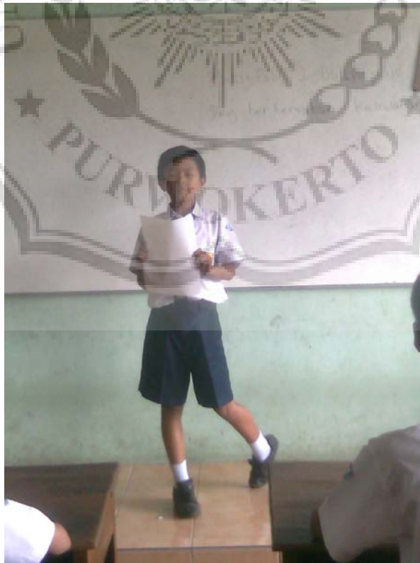
Gambar 6. Siswa membacakan hasil menulis puisi